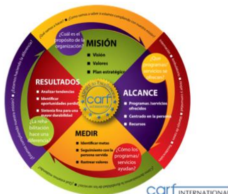
Figura No. 3 Medición Impulsada por la Misión de las Organizaciones